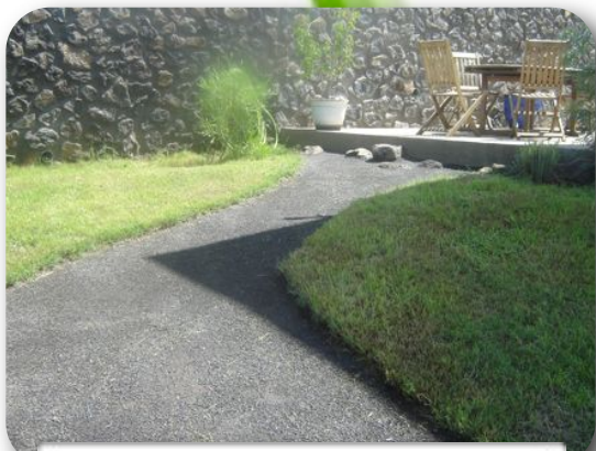
Chemin de jardin