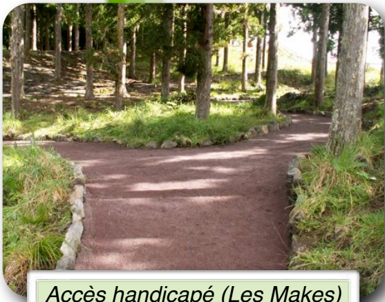
Accès handicapé (Les Makes)

Dans le cadre du développement durable, notre société veut réagir aux nouvelles innovations et propose un nouveau produit perméable et écologique, véritable alternative aux techniques traditionnelles (pavage, béton, enrobé, etc...)