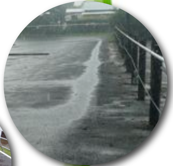
Problème de drainage