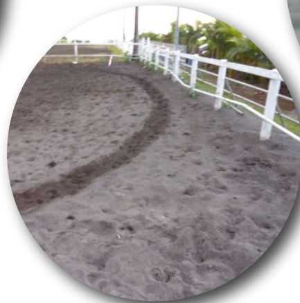
Problème de régularité de la surface et de profondeur du sol