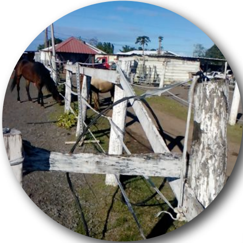
Barrières défectueuses et dangereuses